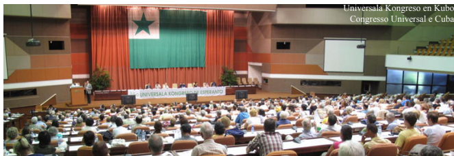
Universala Kongreso en Kubo Congresso Universal e Cuba

Obviamente não temos o mesmo dinheiro que os europeus nem um sistema de transportes que permita viajar por vários países e conhecer a realidade do movimento aqui no continente, mas esse congresso em Cuba serviu para dar uma identidade aos esperantistas latino-americanos e permiti-los vivenciar uma experiência internacional na língua. E que venha o TAKE em 2011! ❀